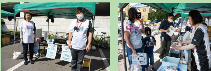
実際に飲んで試せる災害対応浄水器「SESERA」。多くの方に体験いただきました！