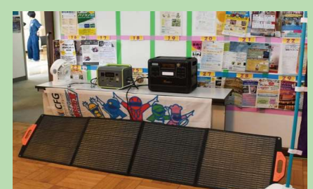
好評販売中の災害対策バッテリー

屋外会場では、当社が販売代理店を務める 災害対応浄水器「SESERA」 を使用した汚水のろ過体験を実施し、お子様連れの来場者に大変好評をいただきました。製造元である株式会社サイテックス様も急遽群馬県よりご参加いただき、サポートをいただきました。