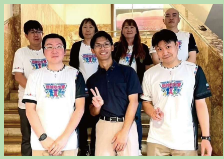
現地参加されたみなさん